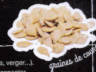
graines de courges